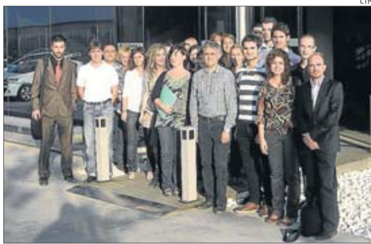
Els participants al projecte Optiener

Optiener generarà cinc llocs de treball directe (tècnics especialitzats i doctorats) entre tots els participants del consorci Grup Soler, CTM i MCIA-(UPC), i preveu generar una quantitat no concreta de llocs de treball indirecte en el sector de la construcció, ja que es pretén afavorir l'evolució de l'activitat d'operaris i instal·ladors cap a sectors vinculats amb l'energia,