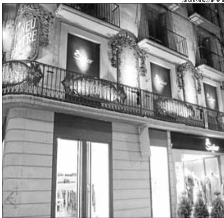
L'establiment de Señor al carrer del Born de Manresa

L'acte que donarà el tret de sortida a la celebració dels 50 anys se