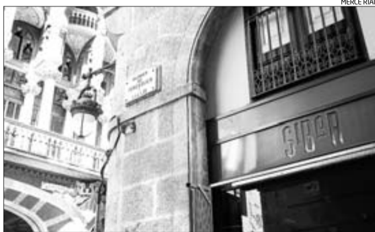
Façana del nou Sibar, just davant del Palau